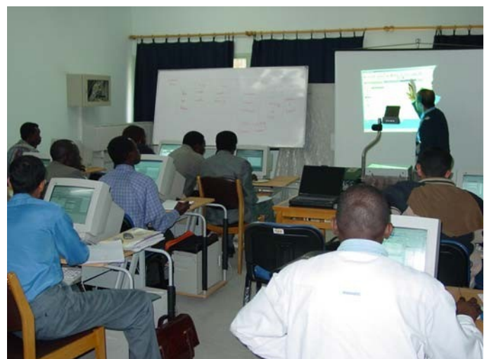
Un cours au Centre