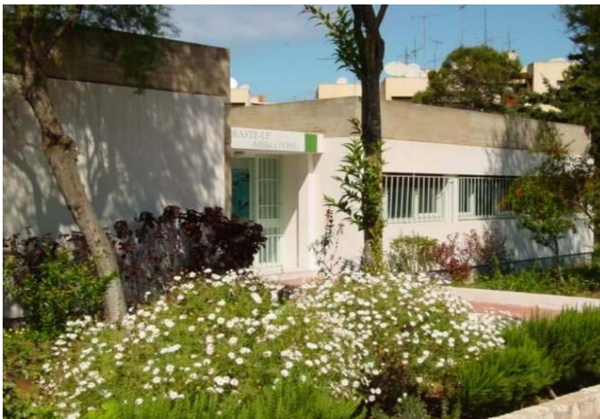
Une vue du Centre

Le logement et l'assurance sont à la charge du candidat.